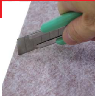
カッターで簡単に切断する事が可能です。