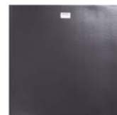
裏面全体にマグネットが貼付けられています。

※A: 数量在庫数により、記載されている出荷可能日での対応ができない場合がありますのでご了承ください。