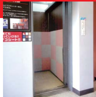
自由な組み合わせが可能です。