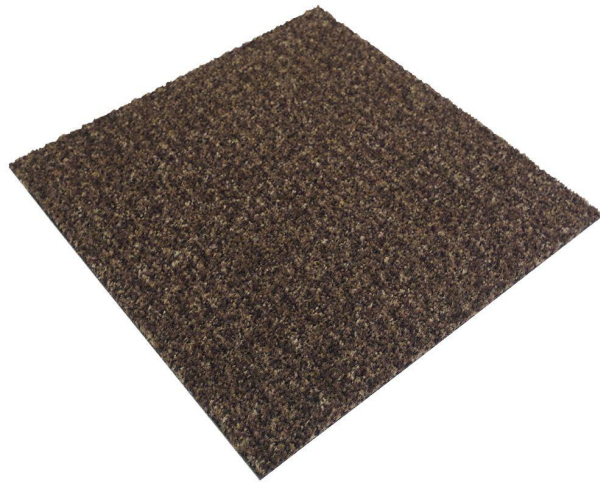
コーラルブラッシュタイル（除塵）