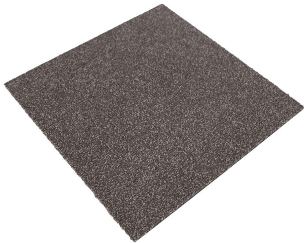
コーラルクラシックタイル（吸水）