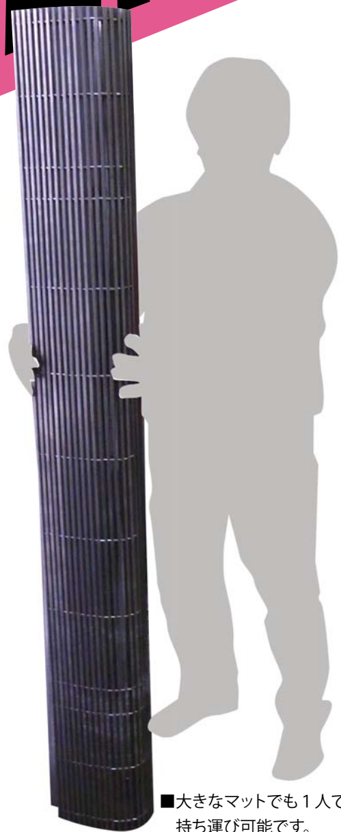
■大きなマットでも1人で持ち運び可能です。