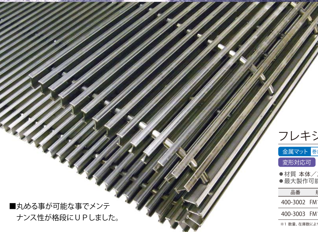
■丸める事が可能な事でメンテナンス性が格段にUPしました。