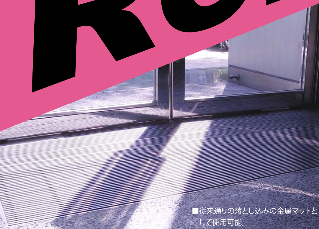
■従来通りの落とし込みの金属マットとして使用可能。