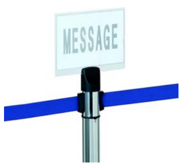
■サインホルダー B5 (392-002)

ステンレスタイプはヘッド部にオプションを装着する事で、多機能に使用する事が可能になっています。 ※本体は別途になります。