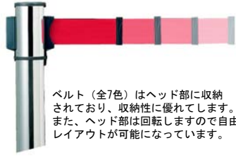
ベルト（全7色）はヘッド部に収納されており、収納性に優れています。また、ヘッド部は回転しますので自由なレイアウトが可能になっています。