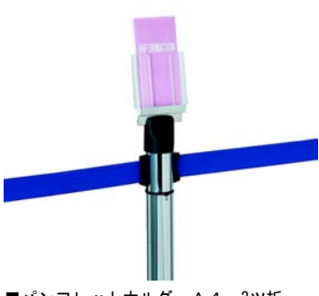
■パンフレットホルダーA4-3つ折 (392-004)

●ベルトパーティション（ステンレスタイプ）のヘッド部に装着するだけでA4サイズのパンフレットホルダーになります。