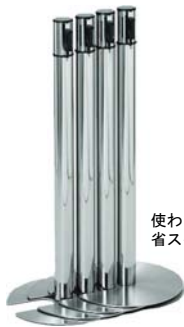
使わない時は重ねられるので、省スペースになり収納に便利です。

自在に動線をコントロールする 人が集まる場所の必需品。 豊富な機能とバリエーションが揃う ベルトパーティションシリーズです。