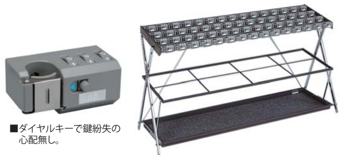
■ダイヤルキーで鍵紛失の心配無し。